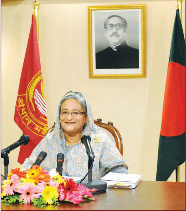
গণপ্রজাতন্ত্রী বাংলাদেশ সরকারের মাননীয় প্রধানমন্ত্রী শেখ হাসিনা