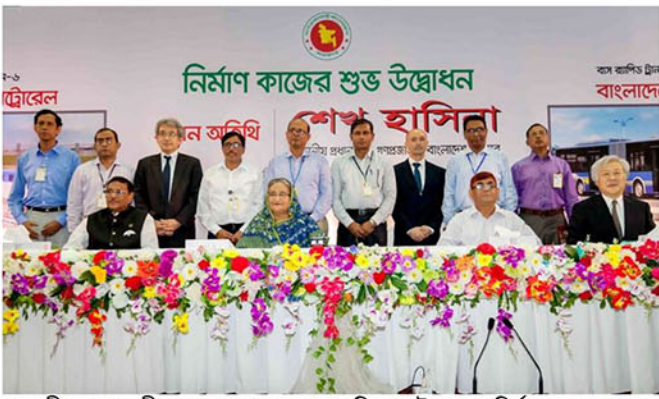
মাননীয় প্রধানমন্ত্রী গত ২৬ জুন, ২০১৬ তারিখ মেট্রোরেলের নির্মাণ কাজের শুভ উদ্বোধন করেন।