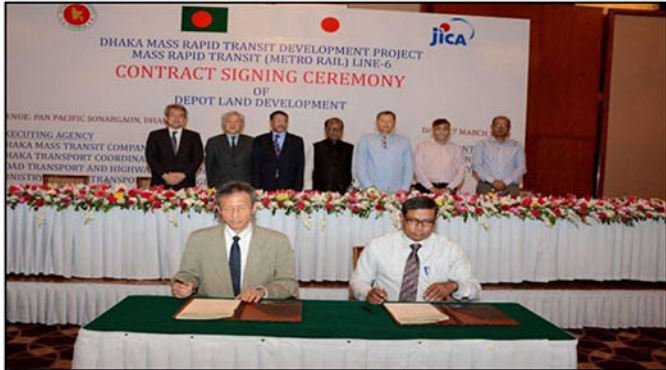
ডিপো এলাকার ভূমি উন্নয়ন কাজে Tokyu Construction Co., Ltd.-এর সঙ্গে ২৭ মার্চ, ২০১৬ তারিখ আনুষ্ঠানিক চুক্তি স্বাক্ষরিত হয়।