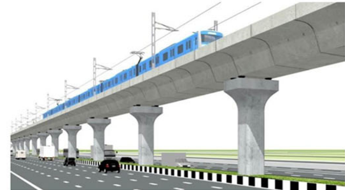
মেট্রোরেল লাইন (ভায়াডাক্ট)