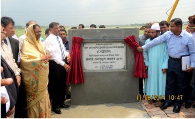
মাননীয় মন্ত্রী (সড়ক পরিবহন ও সেতু মন্ত্রণালয়) ১১ জুন, ২০১৪ তারিখ মেট্রোরেলের ডিপো এলাকার শুভ উদ্বোধন করেন।