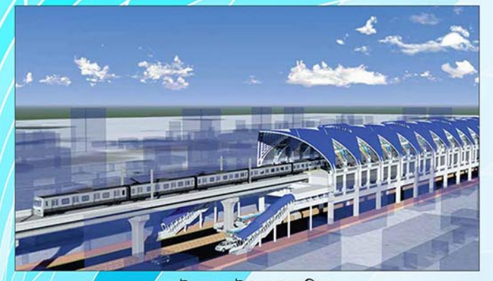
মেট্রোরেল স্টেশন (প্রক্ষেপিত)

"ঢাকা ম্যাস র্যাপিড ট্রানজিট ডেভেলপমেন্ট প্রজেক্ট (DMRTDP) MRT Line-6" টি Fast Track ভুক্ত প্রকল্পসমূহের মধ্যে অন্যতম। প্রকল্পের মেয়াদ জুলাই, ২০১২ থেকে জুন, ২০২৪। প্রকল্পটি Early Commissioning এর জন্য ডিসেম্বর, ২০১৯ লক্ষ্যমাত্রা নির্ধারণ করা হয়েছে। সে মোতাবেক ২০১৯ সনের মধ্যে উত্তরা ৩য় পর্ব হতে আগারগাঁও পর্যন্ত এবং ২০২০ সনের মধ্যে মতিঝিল পর্যন্ত চালু করার সিদ্ধান্ত গ্রহণ করা হয়েছে। সম্পূর্ণ প্রকল্পকে ০৮ (আট) টি Package-এ ভাগ করে বান্তবায়ন কাজ সম্পন্ন করা হবে। প্যাকেজসমূহের সংক্ষিপ্ত পরিচিতি নিম্নরূপঃ