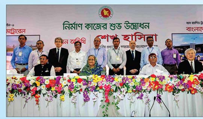
মাননীয় প্রধানমন্ত্রী গত ২৬ জুন, ২০১৬ তারিখ মেট্রোরেলের নির্মাণ কাজের শুভ উদ্বোধন করেন।