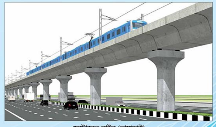
মেট্রোরেল লাইন (ভায়াডাক্ট)