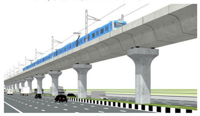
মেট্রোরেল লাইন (ভায়াডাক্ট)