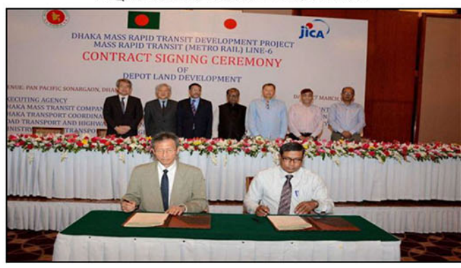
ডিপো এলাকার ভূমি উন্নয়ন কাজে Tokyu Construction Co., Ltd.-এর সঙ্গে ২৭ মার্চ, ২০১৬ তারিখ আনুষ্ঠানিক চুক্তি স্বাক্ষরিত হয় ।