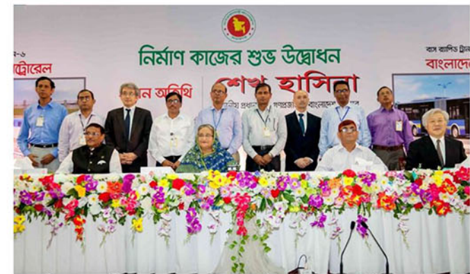
মাননীয় প্রধানমন্ত্রী গত ২৬ জুন, ২০১৬ তারিখ মেট্রোরেলের নির্মাণ কাজের শুড উদ্বোধন করেন।