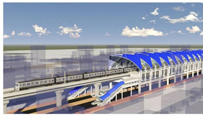
মেট্রোরেল স্টেশন (প্রক্ষেপিত)

ট্রেনের ফ্রিকোয়েন্সি : ৫ মিনিট (দুইটি ট্রেনের মধ্যে সময়ের ব্যবধান)।