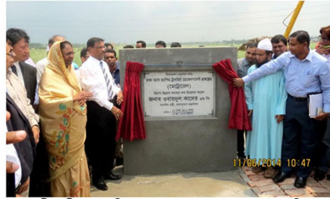
মাননীয় মন্ত্রী (সড়ক পরিবহন ও সেতু মন্ত্রণালয়) ১১ জুন, ২০১৪ তারিখ মেট্রোরেলের ডিপো এলাকার শুভ উদ্বোধন করেন।