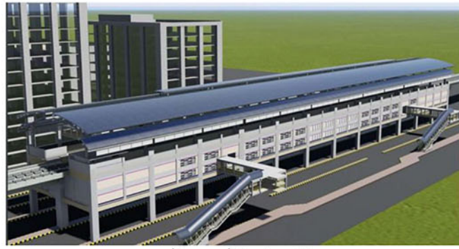
মেট্রোরেল স্টেশন (নকশা)

যাত্রী পরিবহন ক্ষমতা : প্রতি ঘন্টায় ৬০ হাজার (উভয় দিকে)। যাতায়াতের সময় : ৩৮ মিনিট (উত্তরা থেকে মতিঝিল পর্যন্ত)। ট্রেনের ফ্রিকোয়েন্সি : ৫ মিনিট (দুইটি ট্রেনের মধ্যে সময়ের ব্যবধান)।