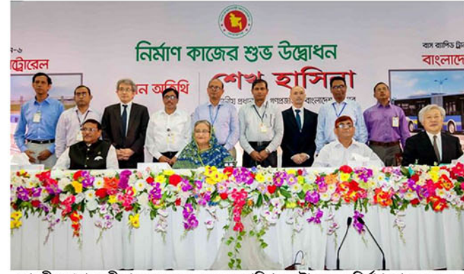
মাননীয় প্রধানমন্ত্রী গত ২৬ জুন, ২০১৬ তারিখ মেট্রোরেলের নির্মাণ কাজের শুভ উদ্বোধন করেন।