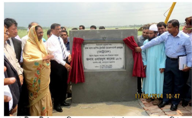
মাননীয় মন্ত্রী (সড়ক পরিবহন ও সেতু মন্ত্রণালয়) ১১ জুন, ২০১৪ তারিখ মেট্রোরেলের ডিপো এলাকার শুভ উদ্বোধন করেন।