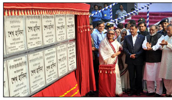
মাননীয় প্রধানমন্ত্রী কর্তৃক ৩১ শে অক্টোবর, ২০১৪ তারিখ মেট্রোরেল প্রকল্পের ভিত্তি প্রস্তর স্থাপন করেন।