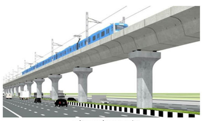
মেট্রোরেল লাইন (ভায়াডাক্ট)