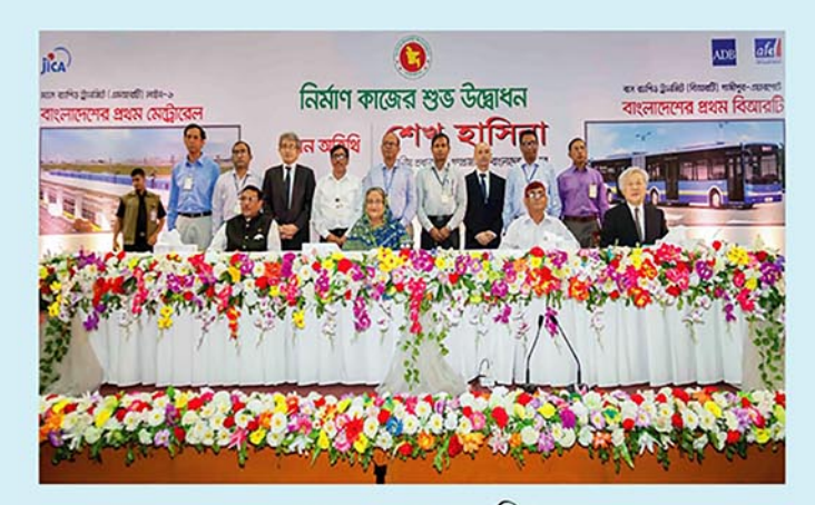
২৬ জুন ২০১৬ তারিখ মাননীয় প্রধানমন্ত্রী মেট্রোরেলের নির্মাণ কাজের শুভ উদ্বোধন করেন

২০৩০ সালের মধ্যে গাবতলী হতে চউগ্রাম রোড পর্যন্ত আন্ডারগ্রাউন্ড ও এলিভেটেড সমন্বয়ে প্রায় ২৪ কিলোমিটার দীর্ঘ G2G ভিত্তিতে MRT-2 নির্মাণের লক্ষ্যে ১৫ জন ২০১৭ তারিখ জাপান ও বাংলাদেশ সরকার সহযোগিতা স্মারক স্বাক্ষর করে। এরই ধারাবাহিকতায় ৬ ডিসেম্বর ২০১৭ তারিখ জাপান ও বাংলাদেশের অংশগ্রহণে বাংলাদেশে প্রথম প্লাটফরম সভা অনুষ্ঠিত হয়। ৭ জুন ২০১৮ তারিখ জাপান ও বাংলাদেশের অংশগ্রহণে জাপানে ২য় প্লাটফরম সভা অনুষ্ঠিত হয়। জাপান সরকারের কারিগরী সহায়তায় MRT-2 এর Pre-Feasibility Study করার নিমিন্ত সুনির্দিষ্ট প্রস্তাব জাপান সরকারের নিকট দাখিল করা হয়েছে। Pre-Feasibility Study সম্পন্ন হওয়ার পর মোট দৈর্ঘ্য, রুট এলাইনমেন্ট, আন্তারগ্রাউন্ড ও এলিভেটেড অংশ, ডিপোর অবস্থান এবং স্টেশন সংখ্যা ও অবস্থান চূড়ান্ত করা হবে। MRT-2 এর সম্ভাব্য রুট এলাইনমেন্ট হল: গাবতলী-Embankment Road-বসিলা- মোহাম্মদপুর বিআরটিসি বাস স্ট্যান্ড-সাত মসজিদ রোড-ঝিগাতলা- ধানমন্ডি ২ নম্বর রোড-সাইন্স ল্যাবরেটরি-নিউ মার্কেট-নীলক্ষেত- আজিমপুর-পলাশী-শহীদ মিনার-ঢাকা মেডিকেল কলেজ-পুলিশ হেডকোয়ার্টার-গোলাপ শাহ মাজার-বঙ্গ ভবনের উত্তর পার্শ্বস্থ সড়ক- মতিঝিল-আরামবাগ-কমলাপুর-মুগদা-মান্ডা -ডেমডা-চউগ্রাম রোড।