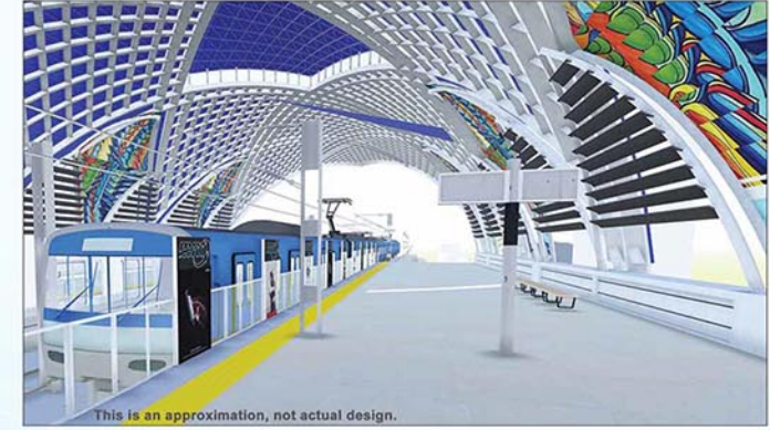
This is an approximation, not actual design.