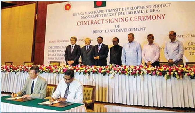
ডিপো এলাকার ভূমি উন্নয়ন কাজে Tokyu Construction Co. Ltd.-এর সঙ্গে ২৭ মার্চ, ২০১৬ তারিখ আনুষ্ঠানিক চুক্তি স্বাক্ষরিত হয়।