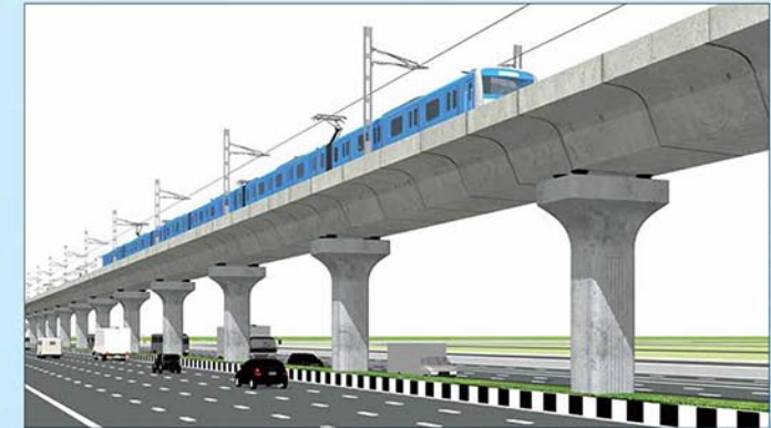
মেট্রোরেল লাইন (ভায়াডাক্ট)