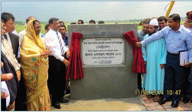
মাননীয় মন্ত্রী (সড়ক পরিবহন ও সেতু মন্ত্রণালয়) ১১ জুন, ২০১৪ তারিখ মেট্রোরেলের ডিপো এলাকার ভূমি উন্নয়ন কাজের শুভ উদ্বোধন করেন।