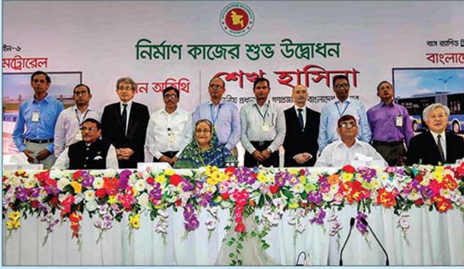
মাননীয় প্রধানমন্ত্রী গত ২৬ জুন, ২০১৬ তারিখ মেট্রোরেলের নির্মাণ কাজের শুভ উদ্বোধন করেন।