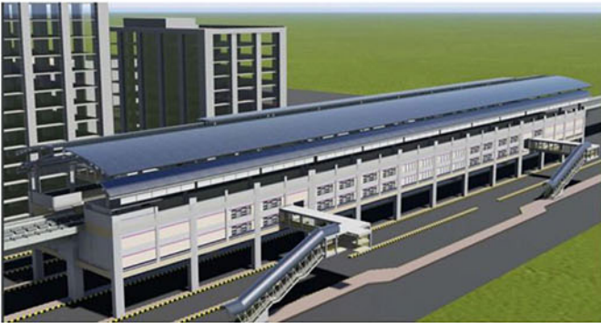
মেট্রোরেল স্টেশন (নকশা)