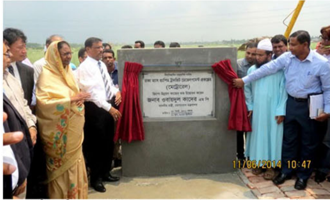
মাননীয় মন্ত্রী (সড়ক পরিবহন ও সেতু মন্ত্রণালয়) ১১ জুন, ২০১৪ তারিখ মেট্রোরেলের ডিপো এলাকার শুভ উদ্বোধন করেন।