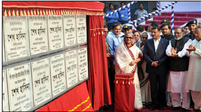
মাননীয় প্রধানমন্ত্রী কর্তৃক ৩১ শে অক্টোবর, ২০১৪ তারিখ মেট্রোরেল প্রকল্পের ভিত্তি প্রস্তর স্থাপন করেন।