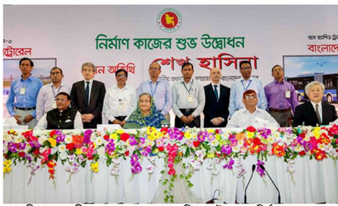
মাননীয় প্রধানমন্ত্রী গত ২৬ জুন, ২০১৬ তারিখ মেট্রোরেলের নির্মাণ কাজের শুভ উদ্বোধন করেন।